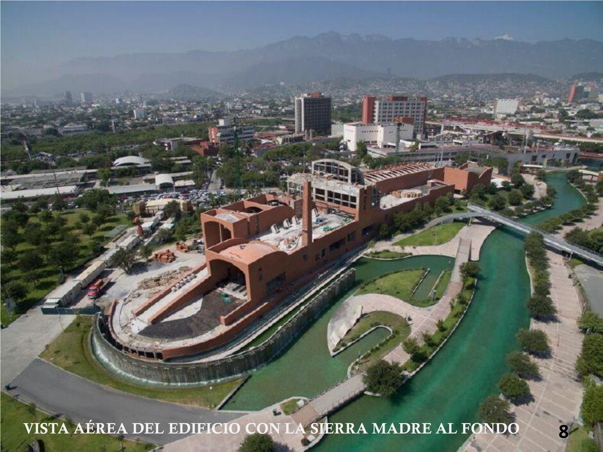
VISTA AÉREA DEL EDIFICIO CON LA SIERRA MADRE AL FONDO