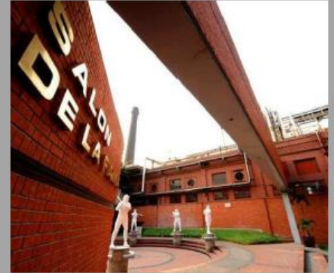
Salón de la Fama del Beisbol Profesional de México en la Cervecería Cuauhtémoc 1973-2013

Por iniciativa y apoyo de la Fundación Alfredo Harp Helú el Salón de la Fama sigue su marcha ahora en el Parque Fundidora. La flama de la inmortalidad sigue ardiendo gracias a su apoyo.