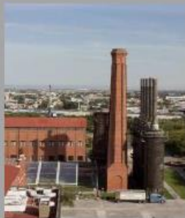
Los edificios históricos del Parque Fundidora son de ladrillo rojo.