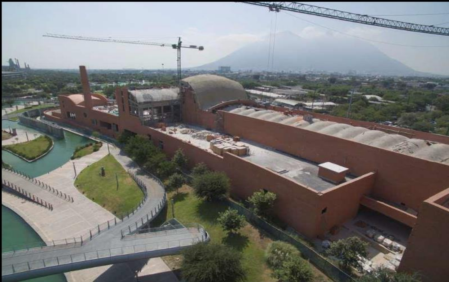
VISTA ÁREA DEL EDIFICIO CON EL CERRO DE LA SILLA AL FONDO