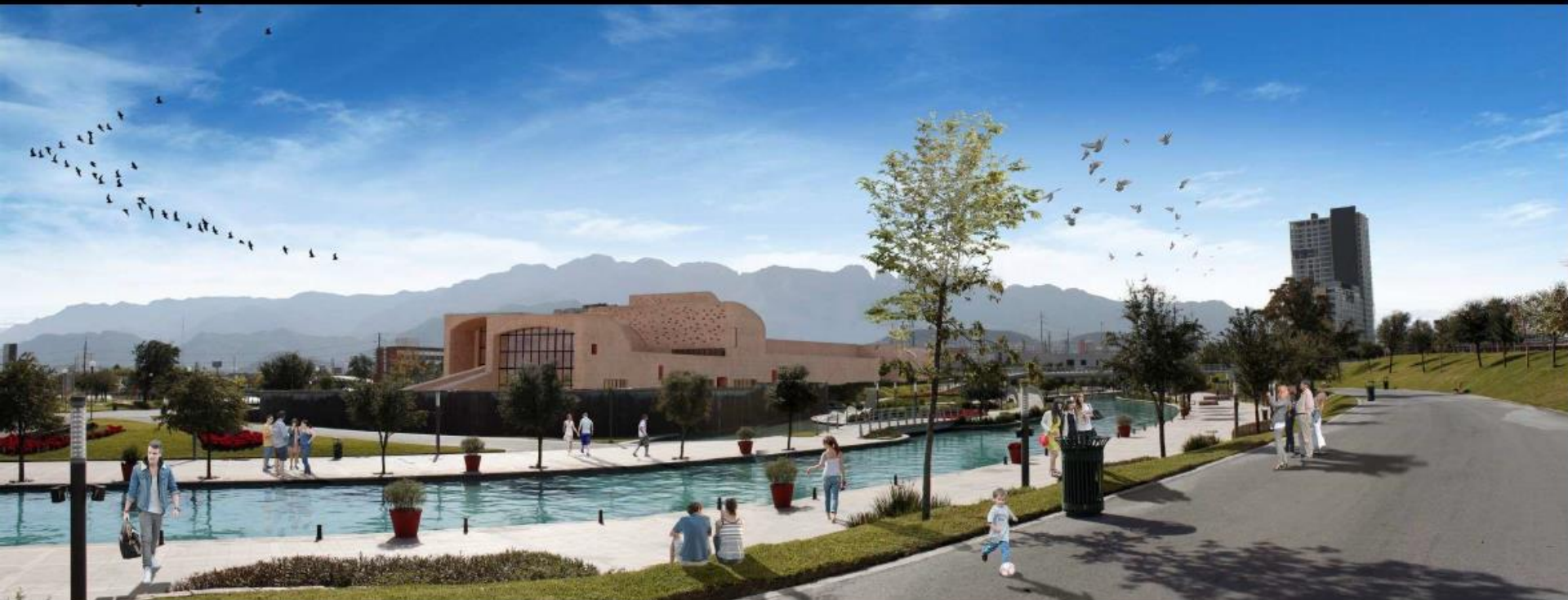
Vista del Salón de la Fama del Beisbol Mexicano desde el Canal Santa Lucía.